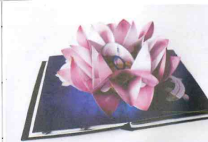
©Benja Harney Kylie Minogue, Goddess Edition, Paper, 42x29x32cm