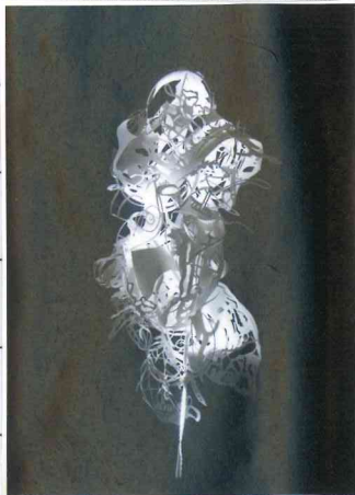
©Yu Jordy Fu Cloud Chandelier, 2012, LED strip lighting, 120x45cm

팝업아트에 처음 들어갔을 때 하나하나 다 보고 싶었다. 뭐든 다 신기했다. 내가 제일 신기해 했던 것은 알루미늄으로 만든 작품이다. 언니가 설명해주었는데 하나하나 잘라서 붙인게 아니라 큰 알루미늄을 잘라서 만든 것이다. 이제 점점 언니의 설명이 듣기 싫어졌다. 나 혼자 여러 군데를 다녔다. 팝업책 읽어주기가 있어서 책 내용을 듣고 갔다. 책에 있는 팝업 중에서 신기한 부분이 있었다. 이제는 사진 까지도 찍기 싫었다. 나는 엄마의 팔에 기대었다. 신기하긴 했지만 목이 마르고 심심해서 짜증이 나는 곳이었다.